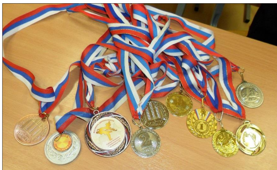
Это мои награды.

В настоящий момент у меня 12 медалей и 1 кубок.