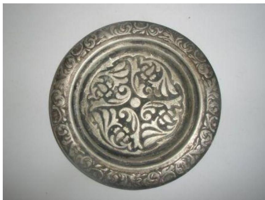
На рисунке представлена старинная тарелка из серебра.

В европейский обиход тарелка вошла в XII-XIII веках. Позже бедняки пользовались глиняными и деревянными тарелками, а люди состоятельные имели оловянную или серебряную посуду. Когда появились первые тарелки, они еще напоминали блюдо, но постепенно их форма изменилась: края приподнялись, тарелка стала круглой и глубокой, при этом дно было плоским. Она приобрела почти современный вид, но оставалась очень большой, потому что была посудой общего пользования.